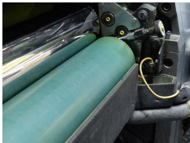
Na schoonmaak met FR 1000