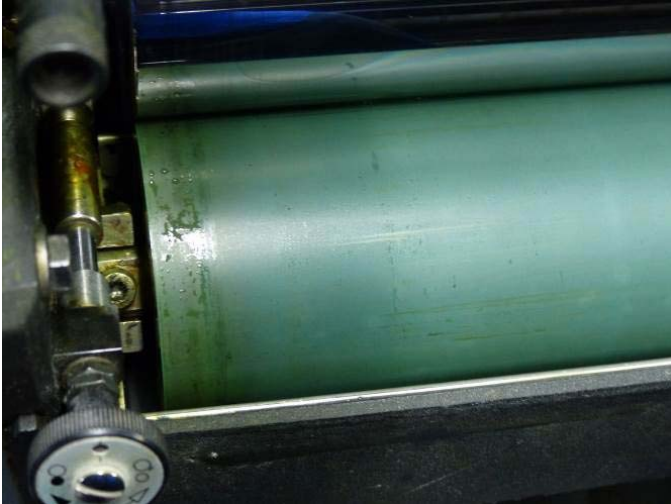
Voor schoonmaak met Puridamp