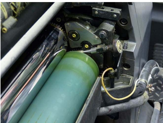
Voor schoonmaak met FR 1000

In de gele druktoeren is de rechterkant van de rol met FR 1000 schoongemaakt en de linkerkant met Puridamp.