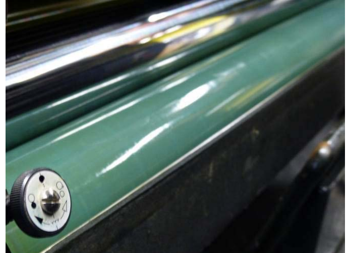
Na schoonmaak met Puridamp

Met FR 1000 of elke andere snel verdampende vochtrolreiniger blijft de rol dof en stroef na schoonmaak. Na schoonmaak met Puridamp ontstaat er direct een gesloten vochtfilm.